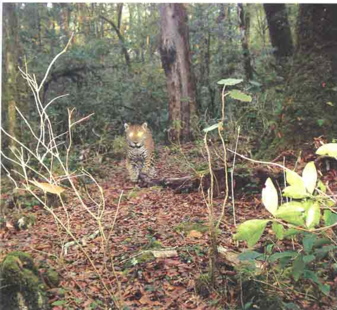
Imagen de una hembra jaguar o jaguar joven captada en febrero de 2007 por una de las cámaras trampa instaladas en ubicaciones estratégicas en las cuales ya se había detectado la presencia de estos felinos.

La modalidad de pago por servicios ambientales hidrológicos también ha sido una herramienta muy útil de conservación en la Sierra, con recursos de la Comisión Nacional Forestal (CONAFOR). En 2003 se inició el programa con el fin de incentivar a los pobladores que cuentan con terrenos de bosque en zonas prioritarias de recarga de mantos acuíferos, a que los conserven mediante la captación e infiltración de agua subterránea. Adicionalmente,